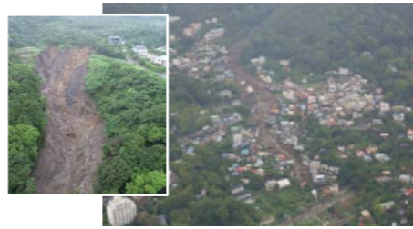
R3.7 静岡県熱海市 死者28名、住宅被害98棟