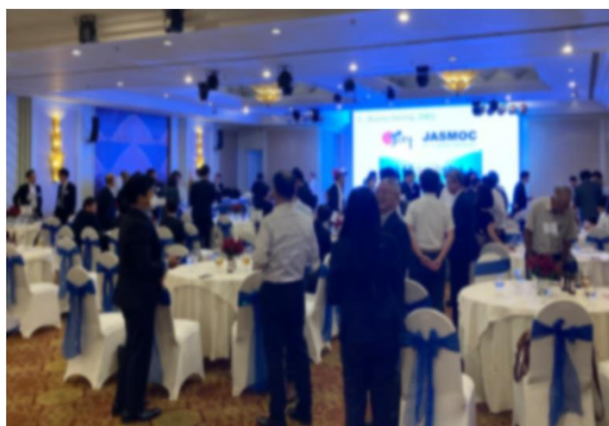
令和4年度 日系企業との交流の様子