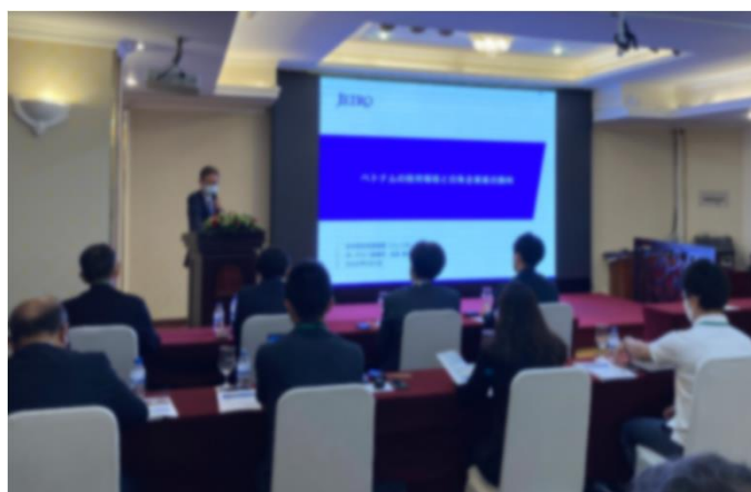
令和4年度 ブリーフィングの様子