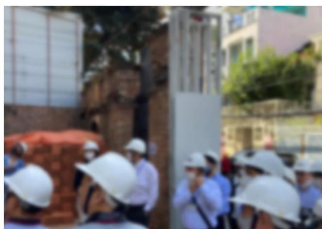
令和4年度 施工現場視察の様子