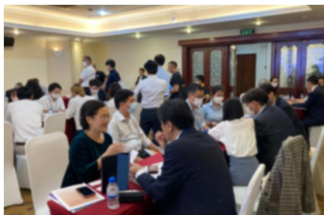
令和4年度 ビジネスマッチングの様子