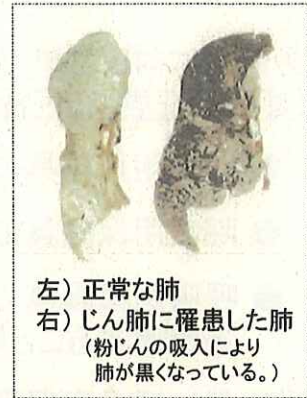
左) 正常な肺 右) じん肺に罹患した肺 (粉じんの吸入により肺が黒くなっている。)

現在、じん肺を治す根本的な治療がないため、じん肺にかからないための措置として、粉じんの発生源対策、局所排気装置等の適正な稼働、呼吸用保護具の適正な着用などにより、粉じんへの「ばく露防止対策」を徹底することが重要です。